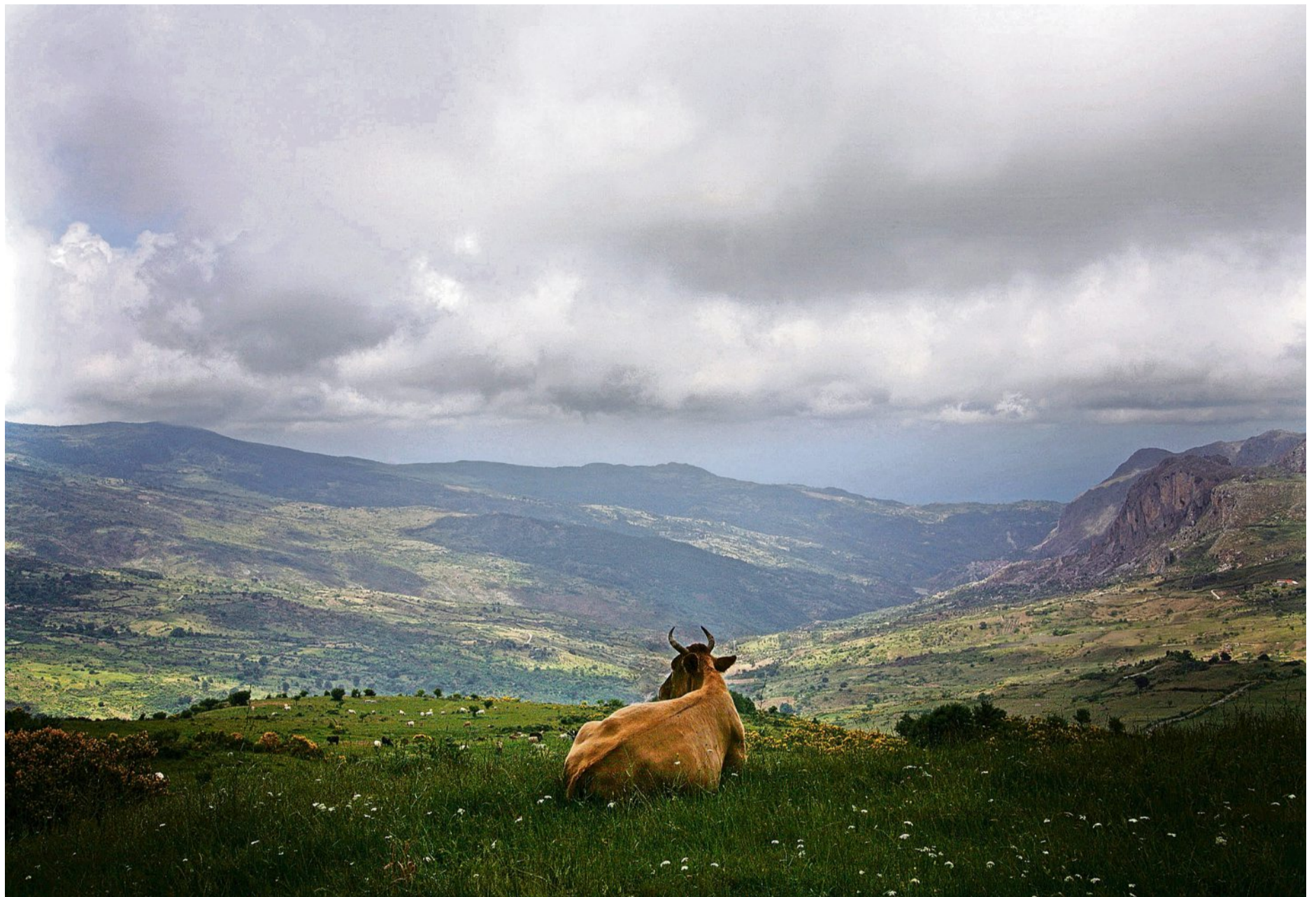
Trügerische Idylle: Die Kühe im Naturpark der Nebrodi sind oft Freiwild – Viehdiebstahl ist ein altes Mittel der Mafia, um Landstriche zu kontrollieren.

Den örtlichen Clans von Cosa Nostra, der sizilianischen Mafia, diene dieses Eden immer schon als Rückzugsgebiet, es bot schier unendlich viele Verstecke für Bosse auf der Flucht. Die 24 Gemeinden auf dem Gebiet des Parks und ihre Behörden bekamen die Präsenz der Mafia stark zu spüren, die Furcht machte viele Menschen stumm.